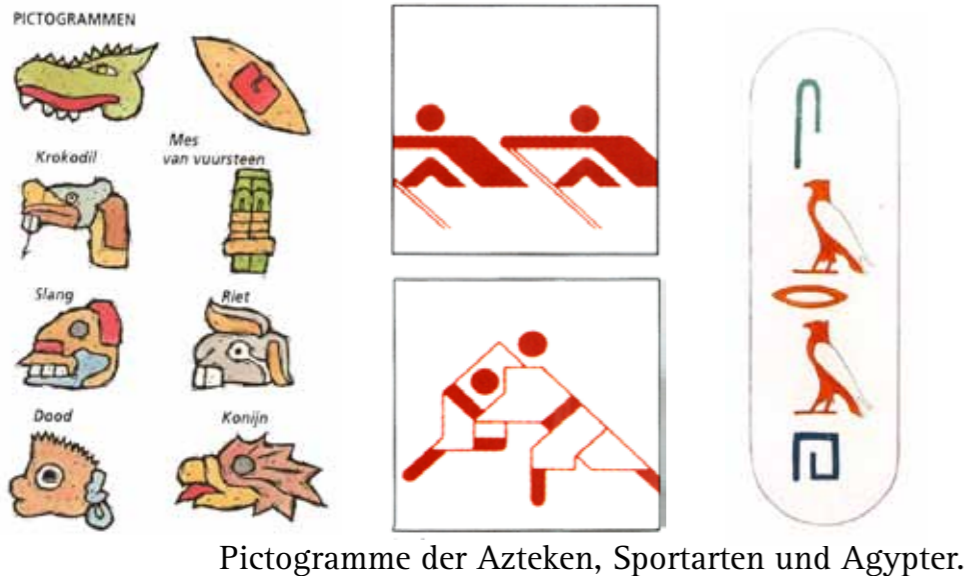
Pictogramme der Azteken, Sportarten und Agypter.

Zur Zeit des Sonnenkönigs waren schmale Taillen und breite Hüften für Frauen sehr in Mode. Daher trugen reiche und modebewußte Damen Reifröcke, die sehr breite Hüften vortäuschten.